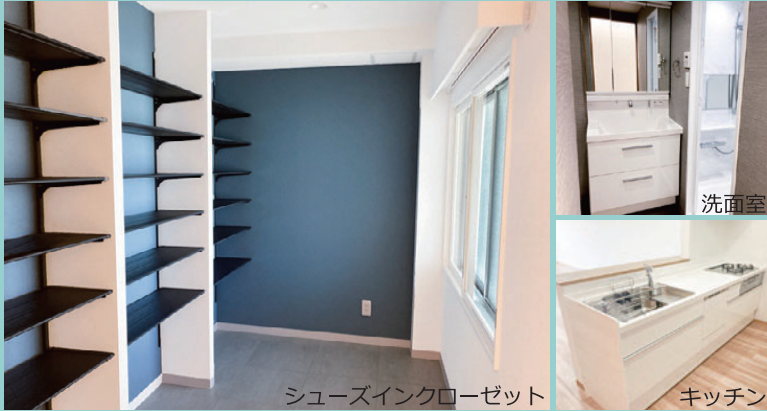
シューズインクローゼット